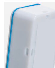
Oeillets de fixation au dos de l'appareil