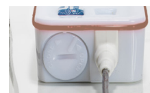
Trappe à pile et sonde de température externe non débrosable