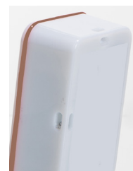
Oeillets de fixation au dos de l'appareil